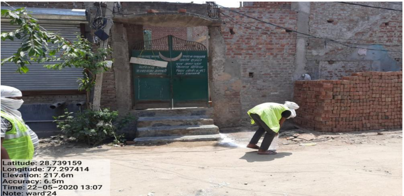
Latitude: 28.739159 Longitude: 77.297414 Elevation: 217.6m Accuracy: 6.5m Time: 22-05-2020 13:07 Note: ward'24