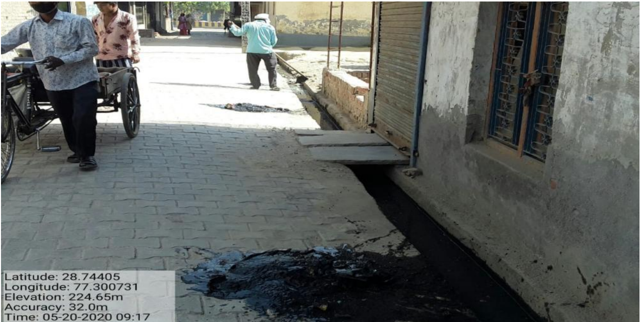
Latitude: 28.74405 Longitude: 77.300731 Elevation: 224.65m Accuracy: 32.0m Time: 05-20-2020 09:17