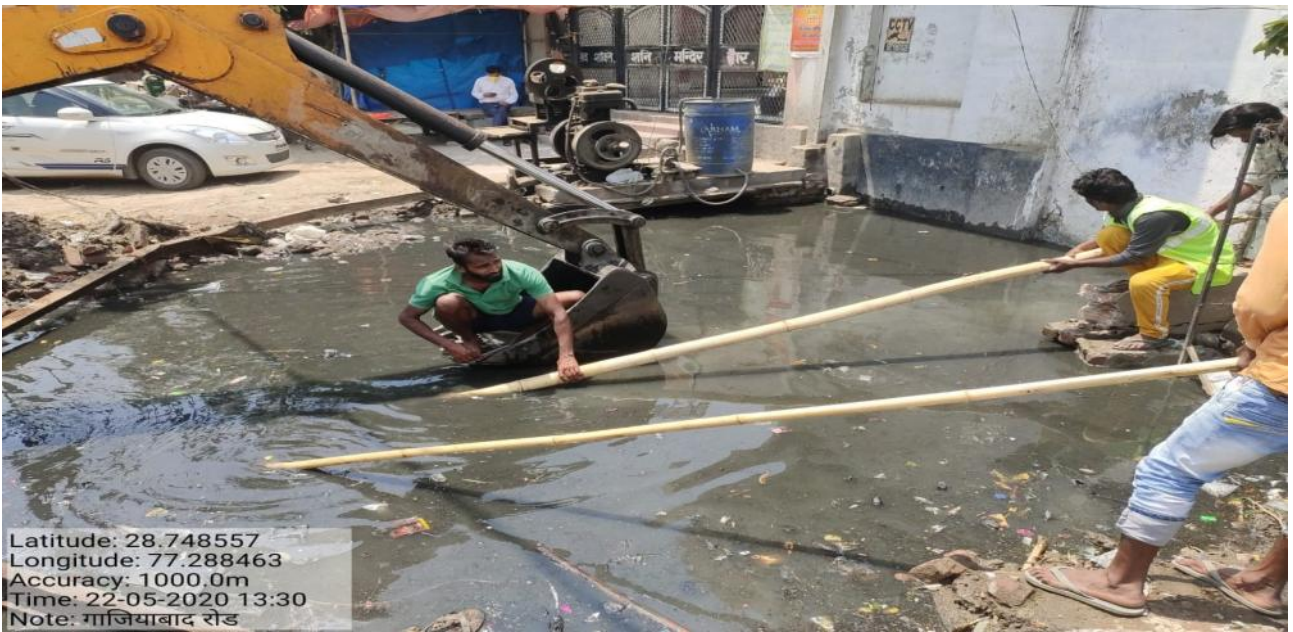
Latitude: 28.748557 Longitude: 77.288463 Accuracy: 1000.0m Time: 22-05-2020 13:30 Note: गाजियाबाद रोड