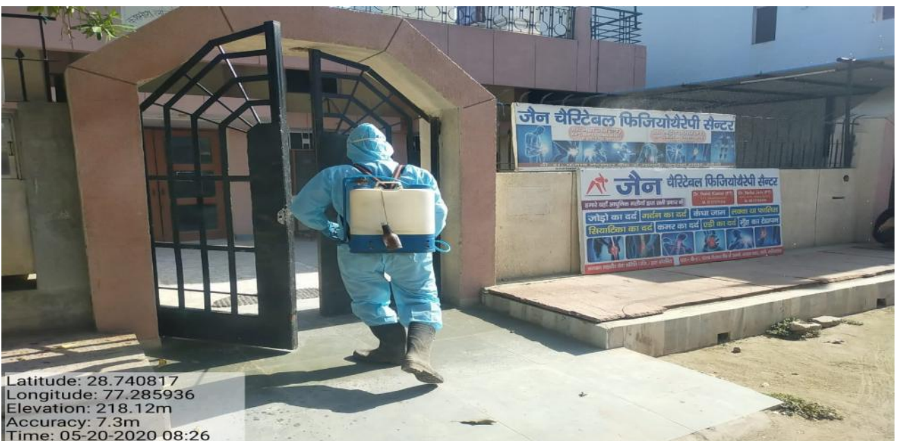
Latitude: 28.740817 Longitude: 77.285936 Elevation: 218.12m Accuracy: 7.3m Time: 05-20-2020 08:26