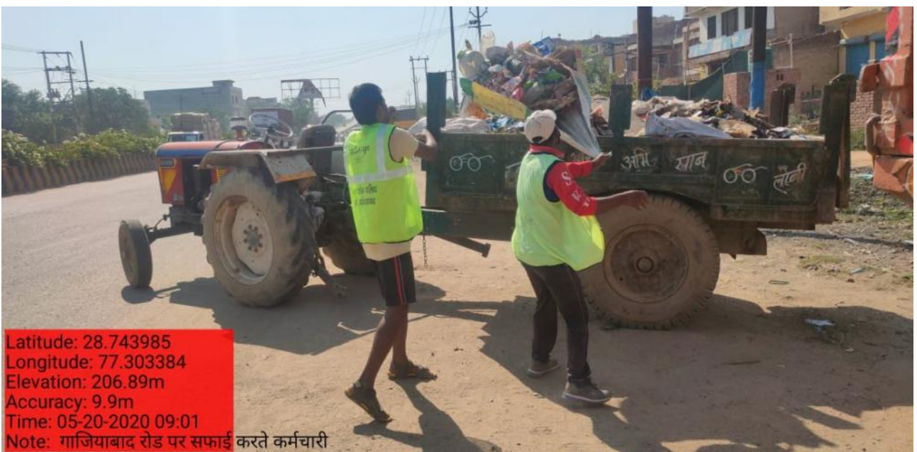
Latitude: 28.743985 Longitude: 77.303384 Elevation: 206.89m Accuracy: 9.9m Time: 05-20-2020 09:01 Note: गाजियाबाद रोड पर सफाई करते कर्मचारी