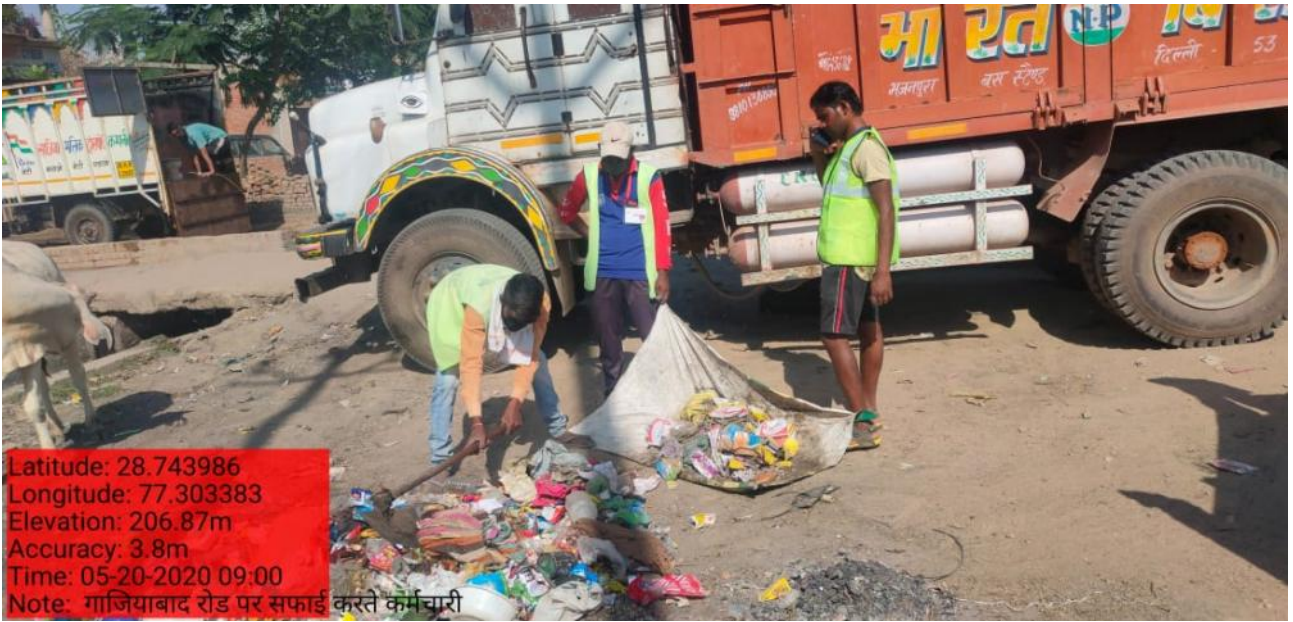
Latitude: 28.743986 Longitude: 77.303383 Elevation: 206.87m Accuracy: 3.8m Time: 05-20-2020 09:00 Note: गाजियाबाद रोड पर सफाई करते कर्मचारी