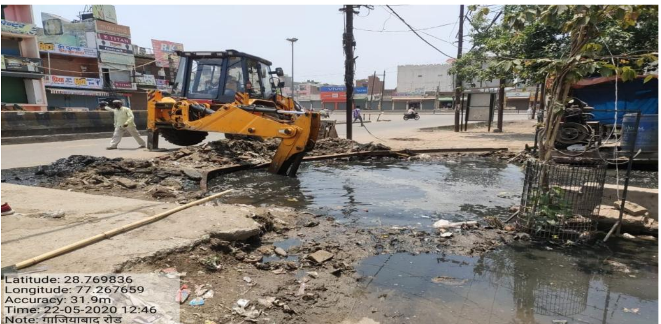
Latitude: 28.769836 Longitude: 77.267659 Accuracy: 31.9m Time: 22-05-2020 12:46 Note: गाजियाबाद रोड