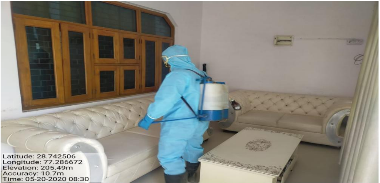
Latitude: 28.742506 Longitude: 77.286672 Elevation: 205.49m Accuracy: 10.7m Time: 05-20-2020 08:30