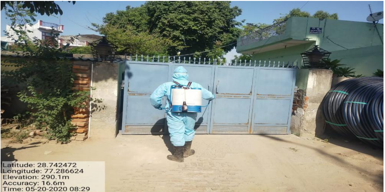
Latitude: 28.742472 Longitude: 77.286624 Elevation: 290.1m Accuracy: 16.6m Time: 05-20-2020 08:29