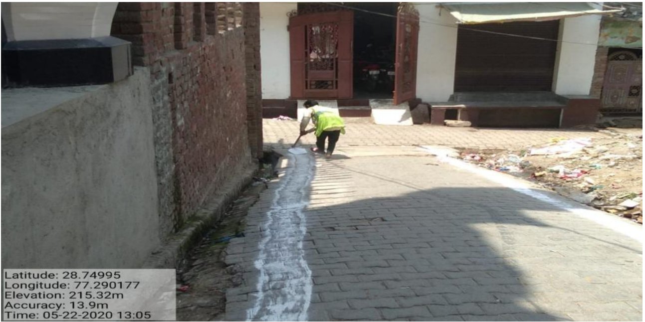
Latitude: 28.74995 Longitude: 77.290177 Elevation: 215.32m Accuracy: 13.9m Time: 05-22-2020 13:05