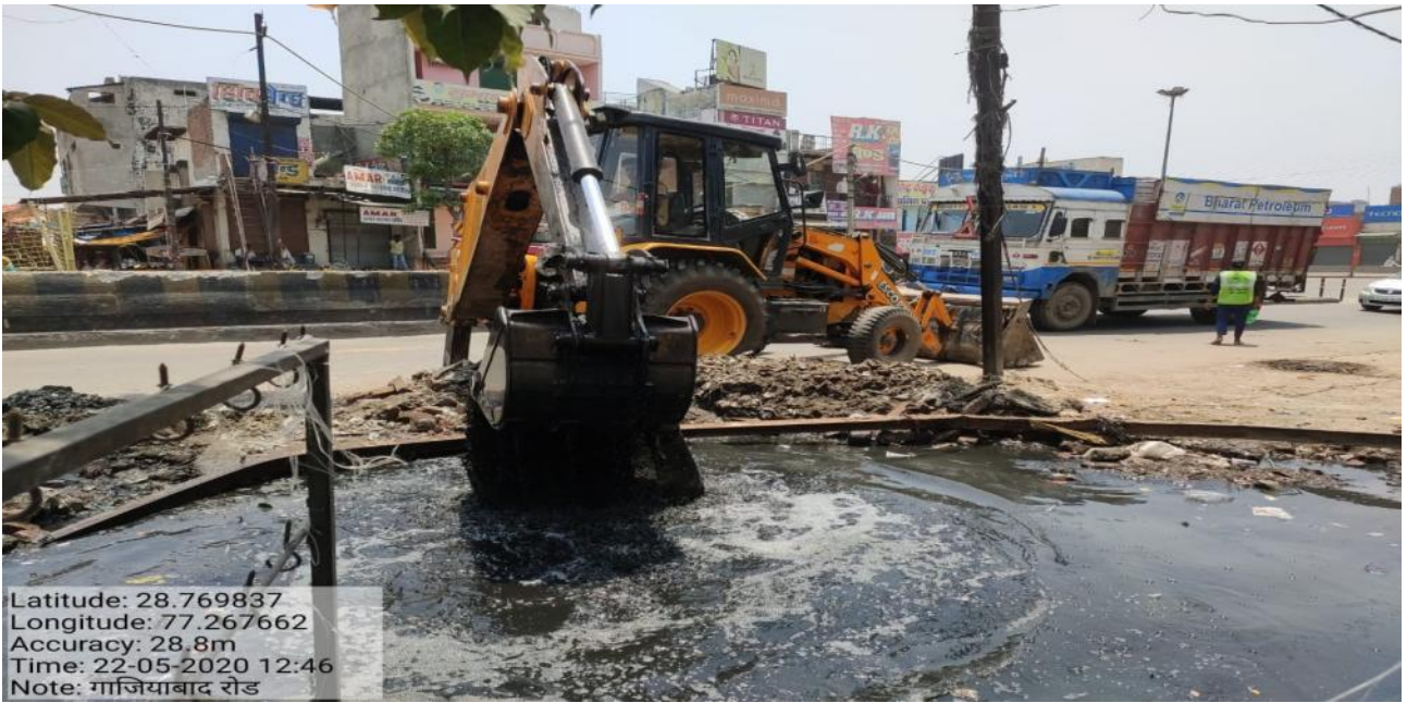
Latitude: 28.769837 Longitude: 77.267662 Accuracy: 28.8m Time: 22-05-2020 12:46 Note: गाजियाबाद रोड