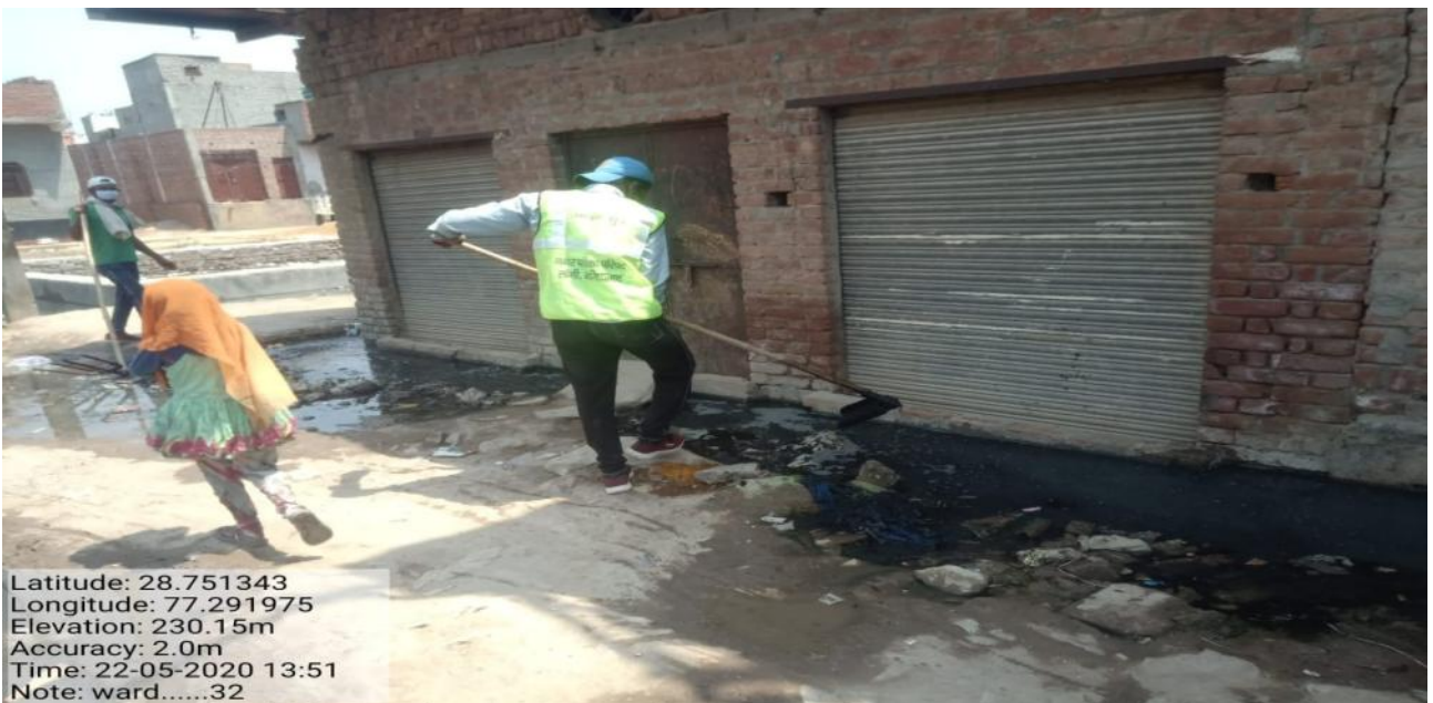
Latitude: 28.751343 Longitude: 77.291975 Elevation: 230.15m Accuracy: 2.0m Time: 22-05-2020 13:51 Note: ward.....32